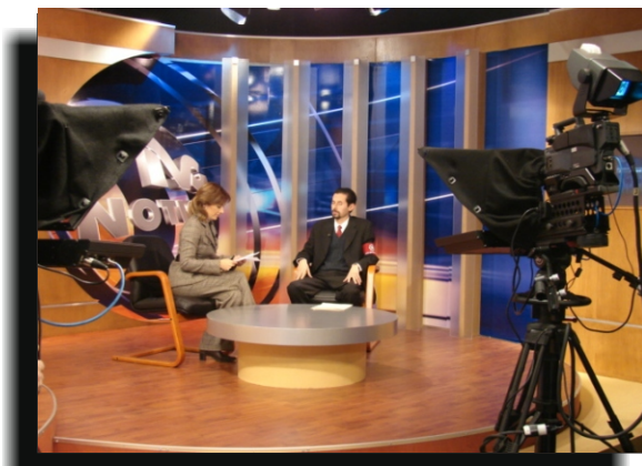
PARNASO en T.V. Defendiendo el derecho de asociación política

En el 2008, PARNASO Distrito Federal, Agrupación Política Local, presentará ante el Consejo General del Instituto Electoral del Distrito Federal, el aviso de que solicitará el registro como Partido Político Local.