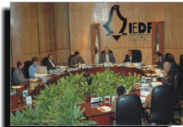
El IEDF otorgó a Parnaso D.F. el registro como APL el 23 de octubre de 2007.

El martes 23 de octubre de 2007, el Consejo General del Instituto Electoral del Distrito Federal, otorgó a PARNASO DISTRITO FEDERAL el registro como Agrupación Política Local (APL).